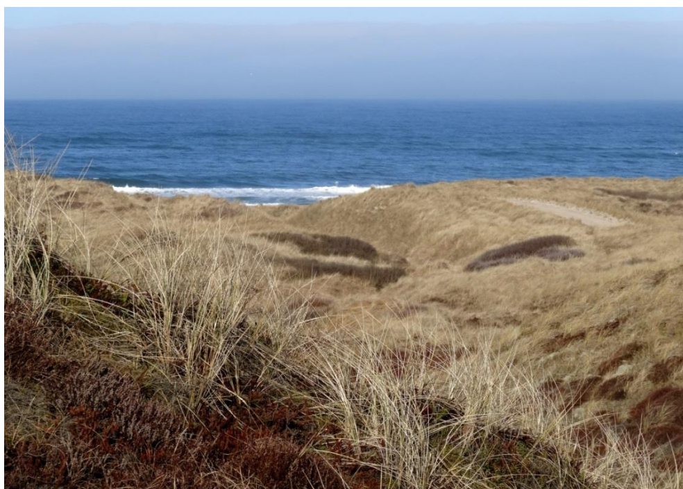
Figur 2: Området består primært af store sammenhængende arealer med klithede.

Den kommunale Natura 2000-handleplan er som udgangspunkt omfattet af krav om miljøvurdering i henhold til lov om miljøvurdering af planer og programmer (lovbekendtgørelse nr. 1533 af 10. december 2015). Thisted Kommune har forud for den endelige vedtagelse af handleplanen foretaget en miljøscreening af denne og truffet afgørelse om, at der ikke er behov for at lave en miljøvurdering. Det er kommunens vurdering, at handleplanens indhold og indsatser overordnet set vil medføre en positiv effekt på naturtyper og arter, som området er udpeget for.