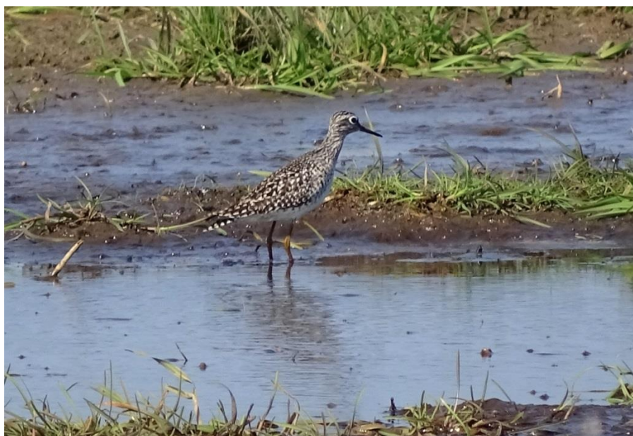
Figur 3: Tinksmed som er en af arterne på udpegningsgrundlaget for fuglebeskyttelsesområde F18.