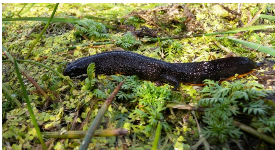
Figur 4: Stor vandsalamander er en af arterne på områdets udpegningsgrundlag.

Der er ingen specifik indsats for arter (bilag 2), udover indsatsen for naturtyperne og indsatsen på offentlige arealer, hvor ejeren gennemfører Natura 2000-planen i egne drifts- og plejeplaner. Indsatsen for naturtyperne forventes i væsentligt omfang at bidrage til at sikre egnede levesteder for arterne.